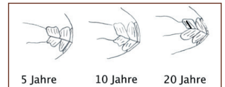
Je älter das Pferd, desto schräger die Schneidezähne.

tional länger sind als die Backenzähne. Im schlimmsten Fall bekommt das Pferd die Backenzähne nicht mehr aufeinander und hat somit Schwierigkeiten beim Fressen. Nach der Zahnbehandlung erfolgt die eigentliche und wichtigste Arbeit. Es muss überprüft werden, ob die Zähne alle gleichmäßigen Kontakt, sprich Okklusion, haben. Der Humanzahnarzt überprüft dies mit speziellem Okklusionspapier, auf das der Patient drauf beißt, beim Pferd erfolgt diese Überprüfung durch eine Sichtkontrolle, während man die Kiefer gegeneinander verschiebt. ◀