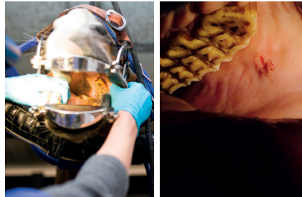
Maulgatter und Lampe helfen, kleine Verletzungen wie der Schleimhäute (re) zu entdecken.

und einer Sonde näher untersucht werden. Auch die Untersuchung mit einem Endoskop, sprich einer Kamera, kann hilfreich sein, will aber gekonnt sein. Ein Humanzahnarzt würde auch nicht ohne eine entsprechende gründliche Untersuchung Zähne behandeln. Beim Pferd erwarten die Besitzer häufig, dass am unседierten Pferd „mal eben“ die Zähne geraspelt werden. Der behandelnde Tierarzt kann aber offene Nervenäste, Karies, kleine Kronenfrakturen etc. übersehen. Nur die scharfen Kanten wegraspeln hat nichts mit einer gründlichen Zahnbehandlung zu tun! Jeder Befund wird auf einem speziellen Zahnbefundbogen dokumentiert und dann mit entsprechenden elektrischen Raspeln behandelt. Zu einer guten Zahnbehandlung gehört auch immer das Kürzen und Beschleifen der Schneidezähne. Der Kaudruck soll gleichmäßig auf Schneide- und Backenzähne verteilt sein, es muss ein Gleichgewicht herrschen. Werden nur die Backenzähne behandelt, entsteht zu viel Druck an den Schneidezähnen, da diese nun überpropor-